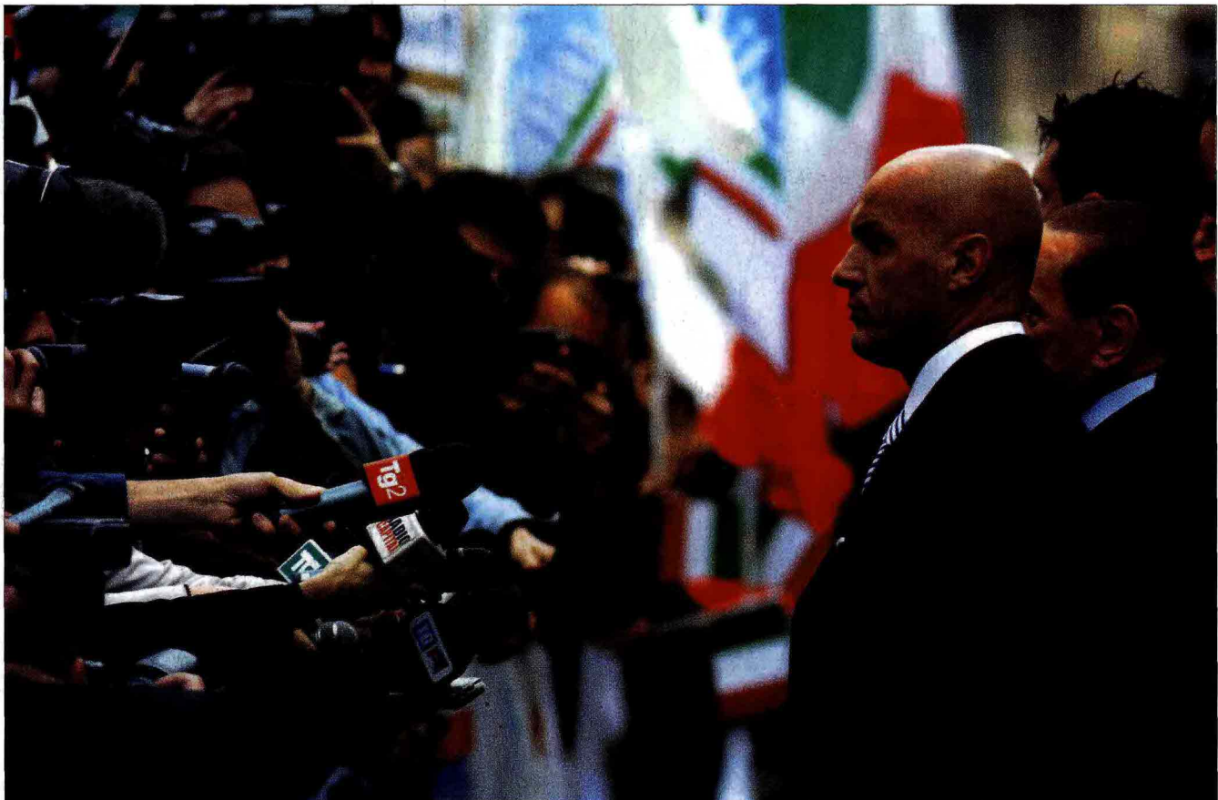
Milano 2011, Berlusconi fuori dal tribunale dopo un'udienza del processo Mediatrade