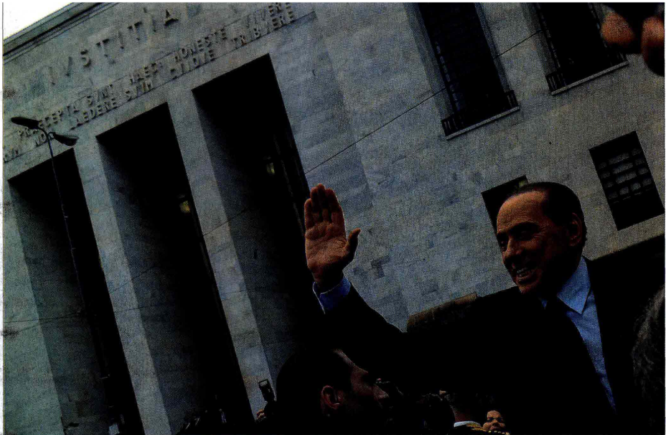
Il tribunale di Milano ha condannato Silvio Berlusconi a 4 anni di reclusione per frode fiscale a conclusione del processo per l'acquisizione dei diritti tv di Mediaset