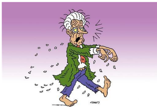
IL RITORNO DEI MONTI VIVENTI

L a proposta per istituire la Commissione d'inchiesta monocamerale sui fatti oscuri, ma con impronte chiarissime di congiurati, farà il suo ingresso in Aula il 16 giugno . Per noi è un atto dovuto alla verità.