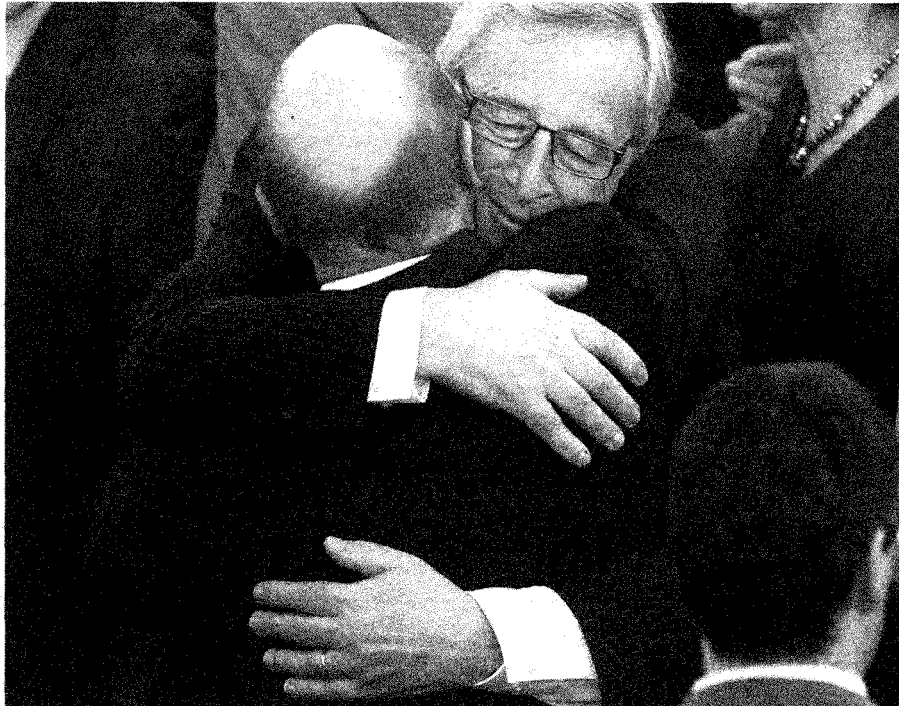
JEAN-CLAUDE JUNCKER E MARTIN SCHULTZ IERI A STRASBURGO A DESTRA, FEDERICA MOGHERINI

Per il lavoro: «300 miliardi in 3 anni». Verrà nominato un responsabile all'immigrazione