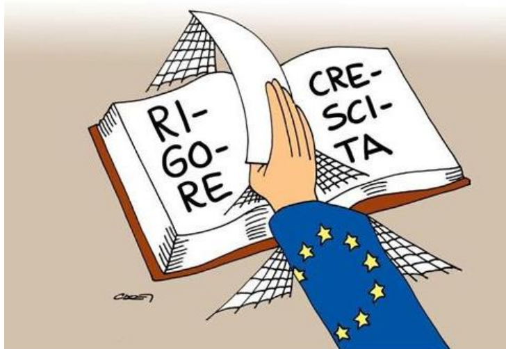
L'EUROPA VOLTA PAGINA

La Ragioneria generale che, in sussulto di dignità, punta i piedi ed impone clausole di salvaguardia che cambiano il segno dell'intera manovra . Insomma un bailamme senza precedenti, che butta al macero una tradizione trentennale.