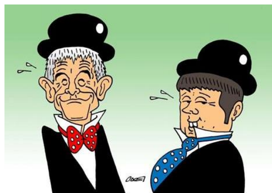
TAGLIO E OLLIO

Torniamo a un gettito totale di 11 miliardi, e le risorse necessarie per finanziare questa misura, pari a circa 20 miliardi di euro, le troviamo utilizzando il meglio della Spending review del commissario Cottarelli : un lavoro certosino che non merita di rimanere nel cassetto.