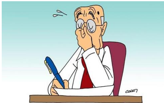
LA FIRMA DELLA LEGGE DI STABILITÀ

C i vorrà del tempo per capire la reale portata della “legge di stabilità” . Le norme sono relativamente chiare, ma i loro riflessi finanziari, indispensabili per coglierne la cifra effettiva, sono disseminati in un numero particolarmente elevato di tabelle . Scritte con caratteri talmente piccoli da somigliare a quelle clausole capestro contenute in tanti contratti di assicurazione, che l'ignaro automobilista sottoscrive. Salvo trovarsi scoperto nel momento del bisogno.