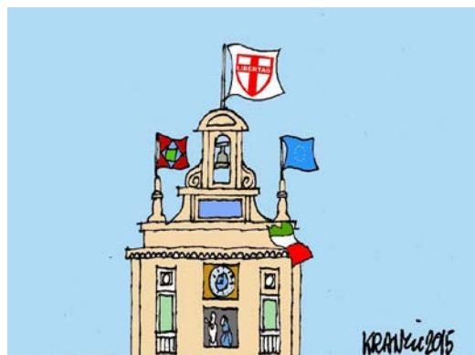
IL VENTO STRACCIA IL TRICOLORE

Il percorso di riscrittura della Costituzione e della legge elettorale iniziato il 18 gennaio tra Renzi e Berlusconi, è stato vanificato da questa elezione presidenziale