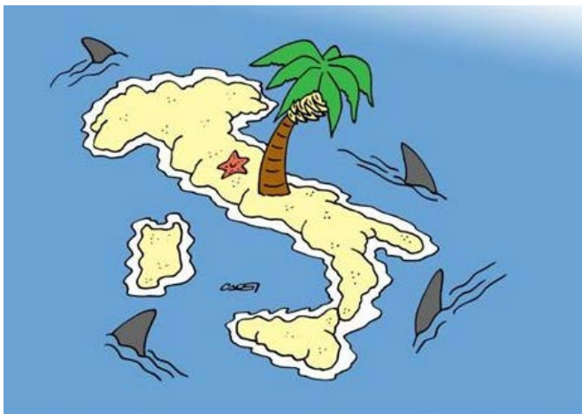
L' ISOLA DEL TESORETTO

I dubbi sorgono spontanei e, in questi giorni, non sono sorti solo a noi di Forza Italia , ma anche ad organismi tecnici specializzati come l'Ufficio Parlamentare di Bilancio o il servizio bilancio del Senato.