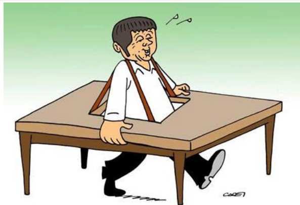
IL TAVOLO RIFORME

Così la sentenza della Cassazione depositata il 19 dicembre scorso cancella quella che condannò il leader di Forza Italia e che paga ancora oggi. Ormai c'è la certezza della riabilitazione a Strasburgo