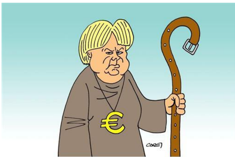
ORTODOSSIA DEL RIGORE

L'immagine plastica di questa assenza? Ore nove del mattino, su Sky la diretta televisiva con traduzione simultanea di quanto sta accadendo al Bundestag di Berlino.