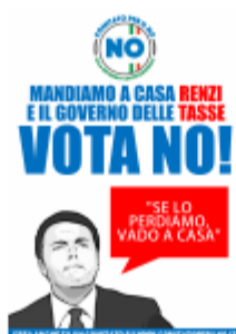
MANDIAMO A CASA RENZI