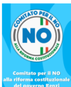
IL VOLANTINO DEL NO