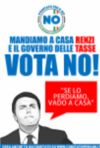
MANDIAMO A CASA RENZI