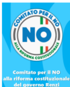
IL VOLANTINO DEL NO