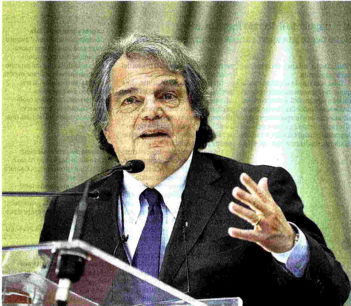
Ministro per la Pa. Renato Brunetta