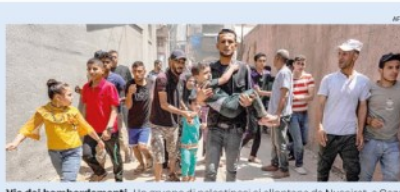
Via dai bombardamenti. Un gruppo di palestinesi si allontana da Nuseirat, a Gaza

LA GUERRA IN MEDIO ORIENTE Borrell: Stati Ue pronti a riconoscere la Palestina Tregua, pressing su Hamas Magnani e Romano — a pag. 7