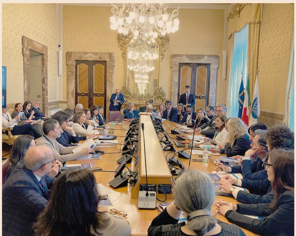
Tavolo di confronto. I partecipanti alla giornata del 16 aprile 2024.