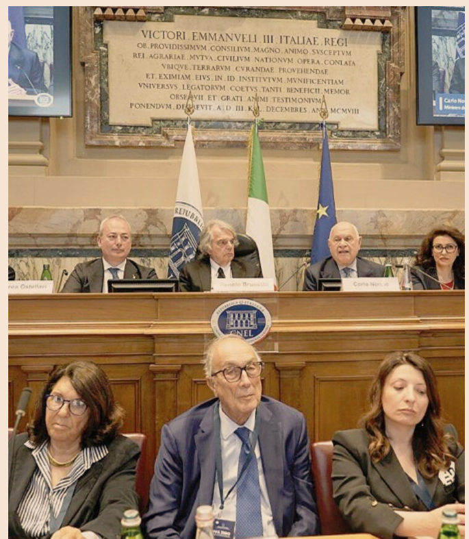
Al centro del dibattito. Un'istantanea della giornata di lavoro del 16 aprile