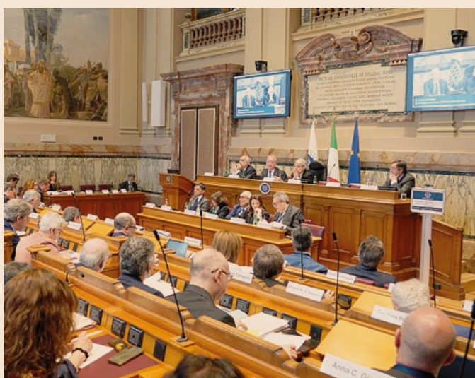
A Villa Lubin. I lavori della giornata del 16 aprile

degli 80,7 milioni di euro è stato attribuito a Regioni e Province autonome e fra queste la Campania risulta essere l'ente con il maggiore importo finanziato (9,6 milioni di euro), a seguire, la Lombardia (7,7 milioni di euro) e l'Emilia-Romagna (6,2 milioni di euro).