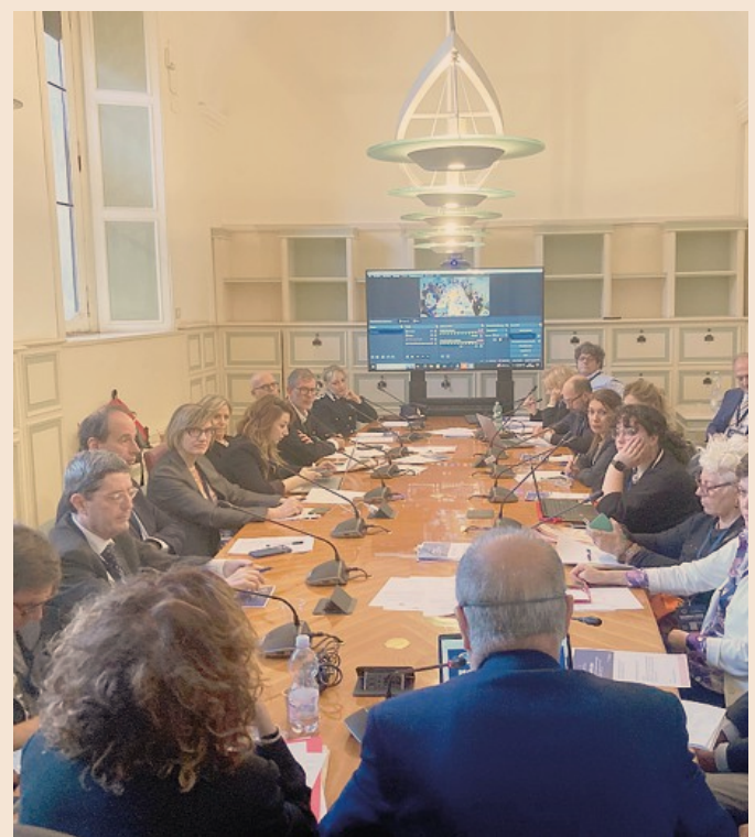
In seduta. Si sono riuniti rappresentanti degli enti pubblici e privati