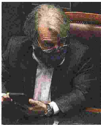
Il ministro della Pa Renato Brunetta

Credibilità Un asset del nostro presidente del Consiglio è la credibilità. E il valore è che l'Italia può fare deficit e debito senza conseguenze sui mercati